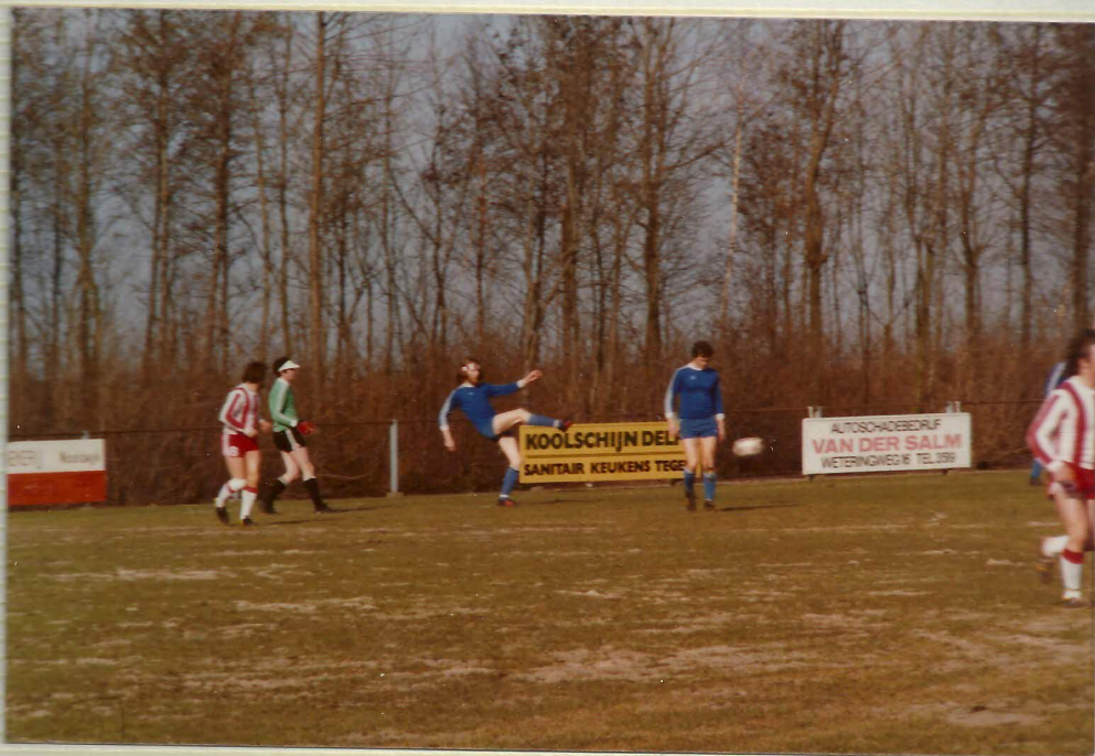
• Ton v.d. G •